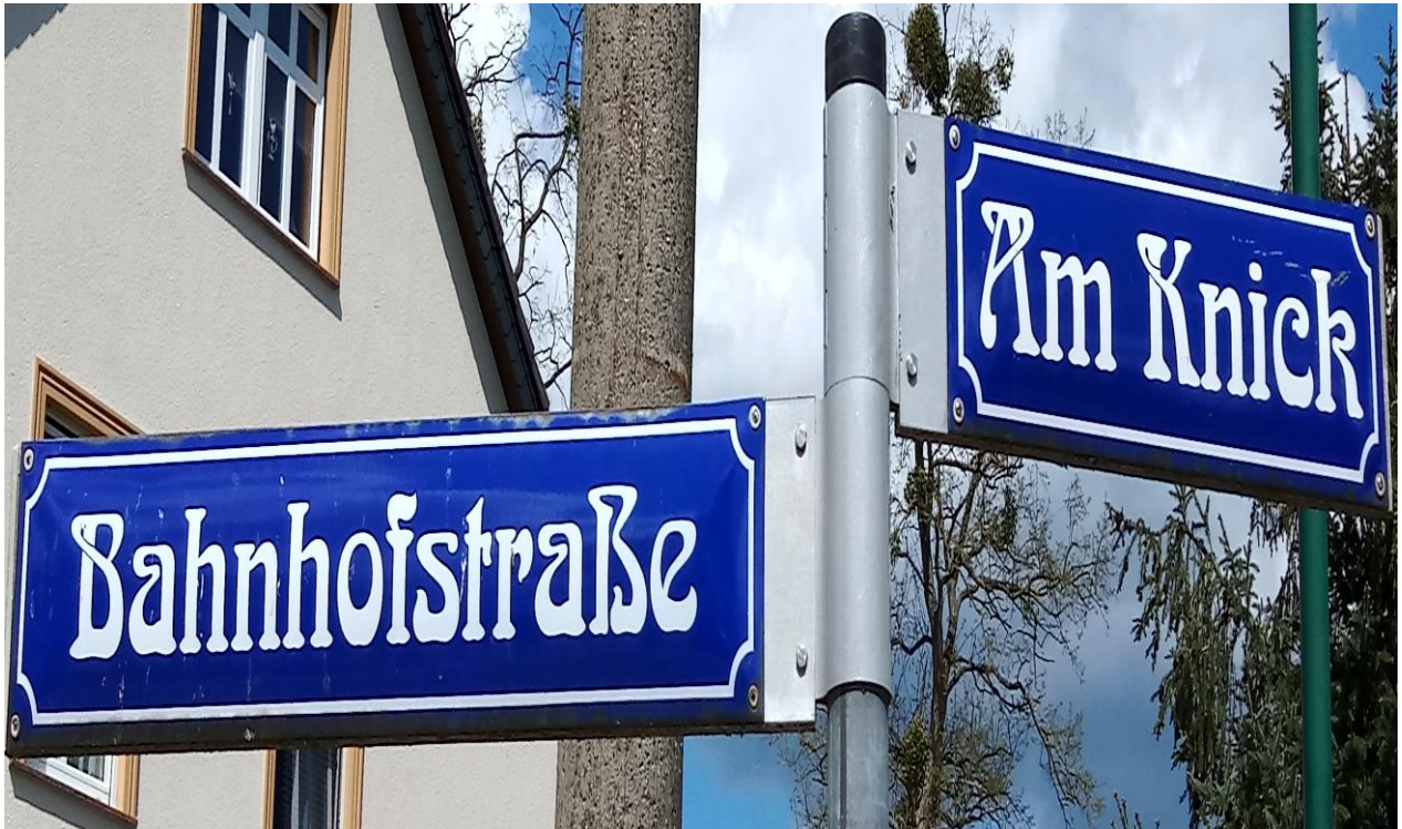
Gehwegausbau in der Straße am Knick Bild 3: Das anliegende Grundstück