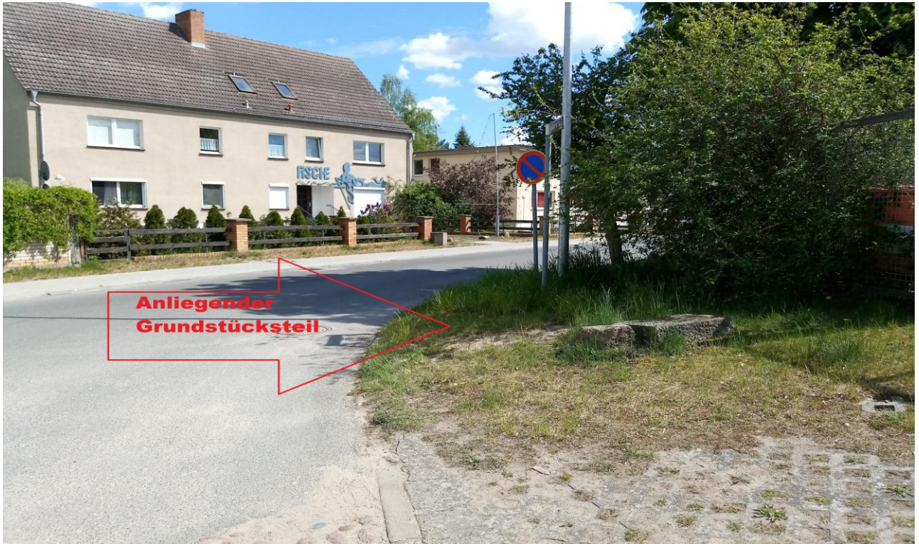
Bild 5: Peter Vida (Mitglied des Landtages Brandenburg und Kreistagsabgeordneter (- Brandenburger Vereinigte Bürgerbewegungen/Freie Wähler-BVB7FW) Initiator der Volksinitiative für die Abschaffung der Straßenausbaubeiträge ..das Beispiel zeigt , dass die Abschaffung der Straßenausbaubeiträge dringend geboten war..